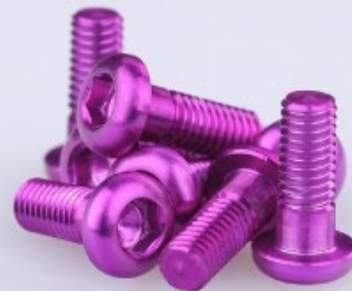
Bolts for Garbaruk Enduro crankset カラー：Black, Silver, Blue, Gold, Green, Orange, Red, Violet 重量：3g 価格：5,100円