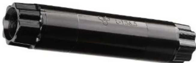
Garbaruk Crankset Spindle サイズ：130mm,136mm,140mm,186mm 重量：93g 価格：13,100円