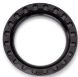
Crank Lock Ring

カラー：Black, Silver, Blue, Gold, Green, Orange, Red, Violet